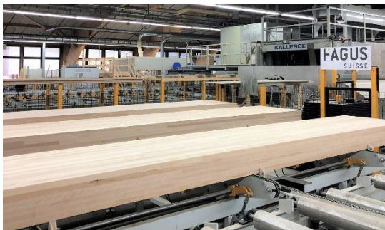
FAGUS_SUISSE_001.JPG Usine de production aux Breuleux. Nouvelle esthétique des poutres en hêtre Fagus

Fagus Suisse SA est l'une des principales entreprises suisses de Woodtech sur le marché en pleine croissance de la construction en bois et est un leader technologique dans la transformation du bois dur. Fondée en 2014 de plus de 130 investisseurs privés et institutionnels en tant que projet national générationnel, Fagus est l'une des rares entreprises suisses de technologie du bois ouverte aux investisseurs privés et institutionnels suisses (Valor CH0376503491).